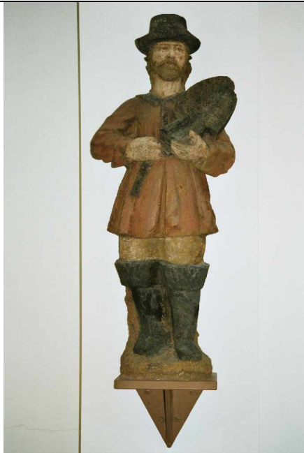
ca. 1 m hoch