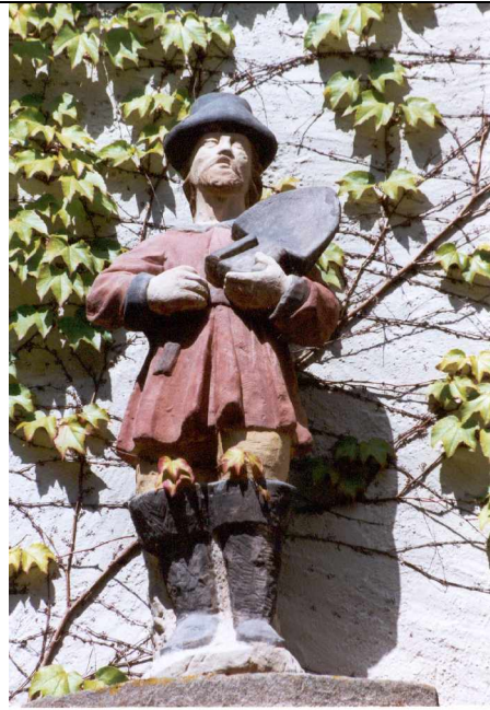
ca. 1 m hoch