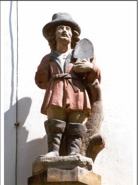
ca. 1,5 m hoch