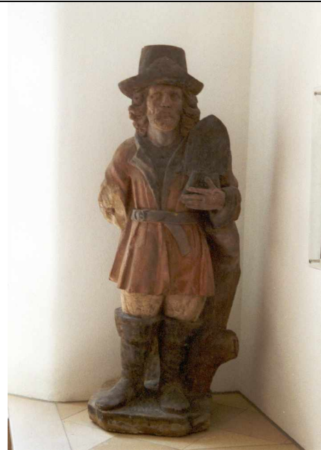
ca. 1,5 m hoch